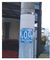
電柱 (海拔 0.00m)