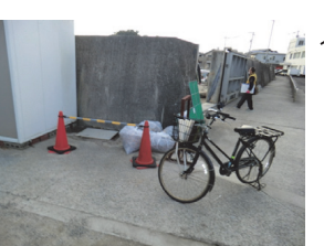
ここから高潮時漏水する防潮堤の排水溝