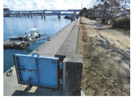
本川右岸 (堤防高 4.31m)

高潮・津波時は、防潮堤を確実に閉めましょう。土砂災害時は江波中学校又は江波小学校、高潮時は江波小学校へ避難しましょう