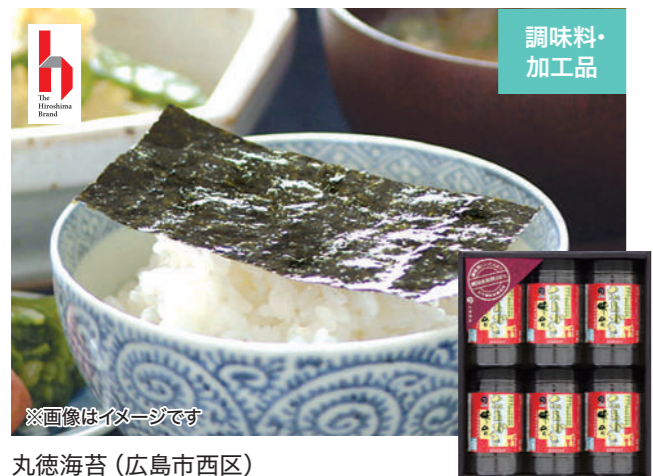
※画像はイメージです 丸徳海苔(広島市西区)