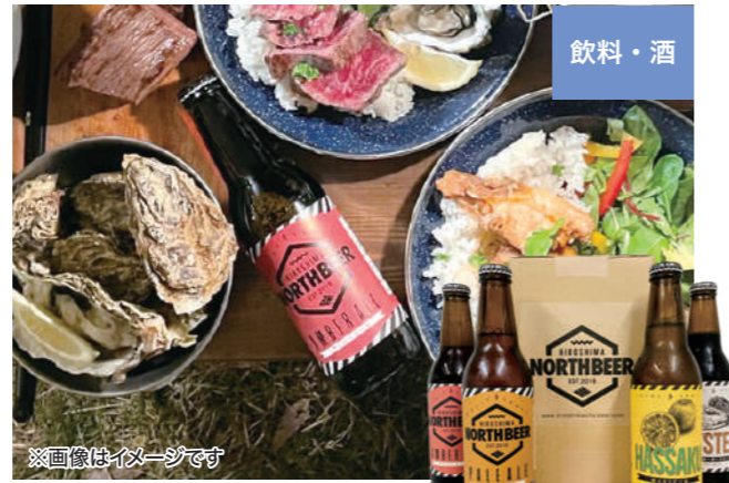
※画像はイメージです 広島北ビール(広島市安佐北区)