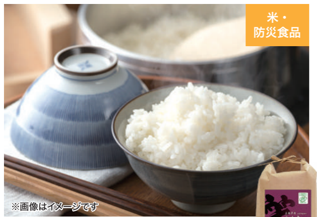
※画像はイメージです カツヤ(広島県海田町)