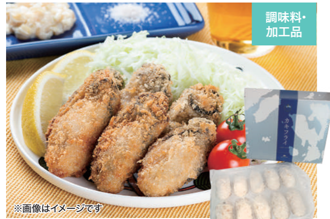
※画像はイメージです マルサ・やながわ水産(江田島市)