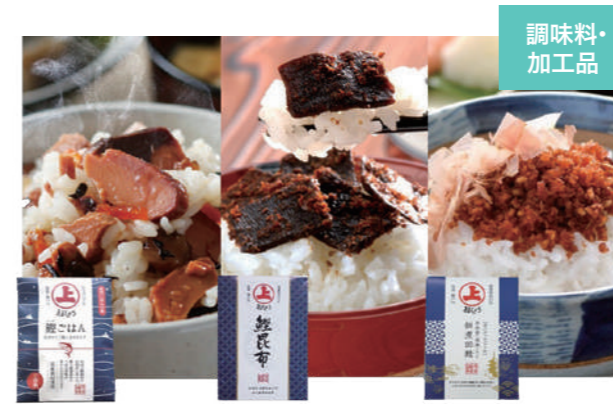
※画像はイメージです まるじょう(尾道市)