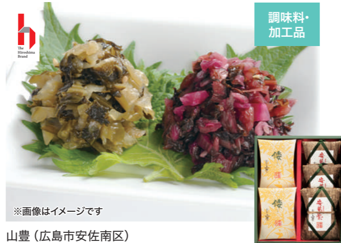
※画像はイメージです 山豊(広島市安佐南区)