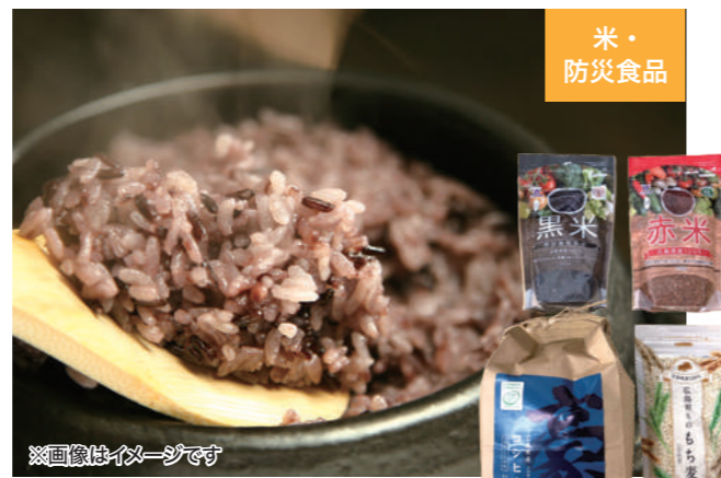
※画像はイメージです カツヤ(広島県海田町)