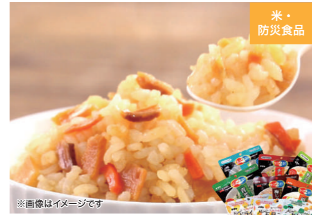
※画像はイメージです サタケ・ビジネス・サポート(東広島市)