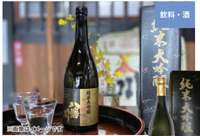
※画像はイメージです 八幡川酒造(広島市佐伯区)