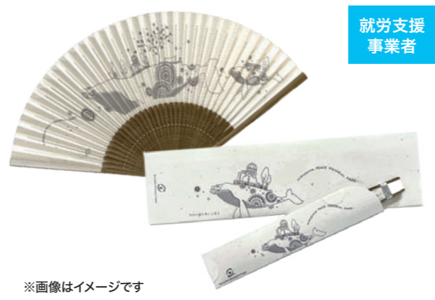
※画像はイメージです 千羽鶴未来プロジェクト(広島市中区)