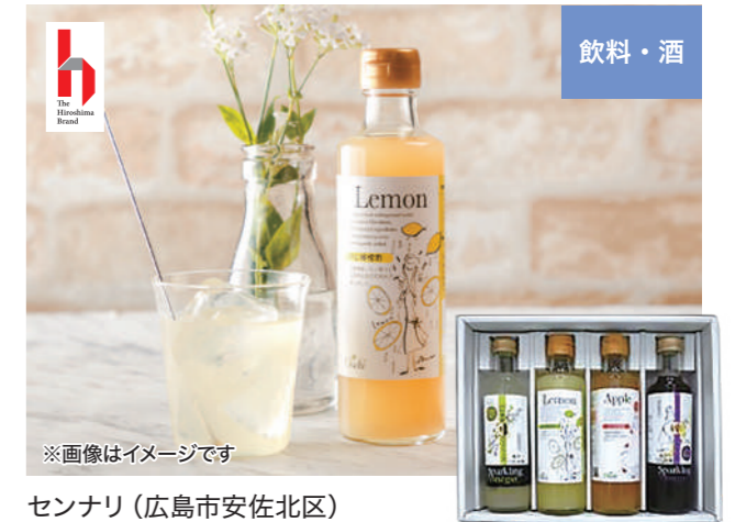
※画像はイメージです セナリ(広島市安佐北区)