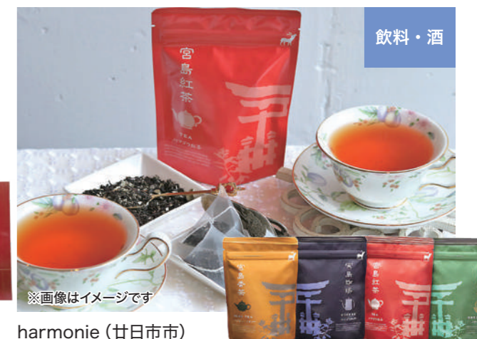
※画像はイメージです harmonie(廿日市市)