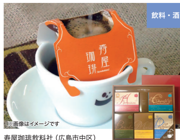
※画像はイメージです 寿屋珈琲飲料社(広島市中区)