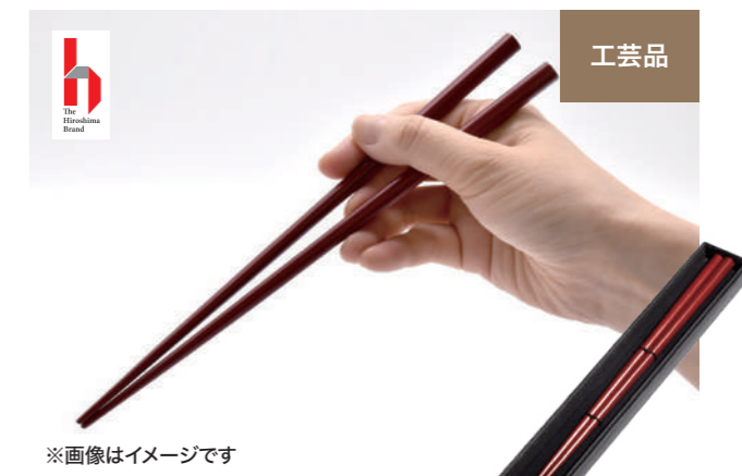
※画像はイメージです 高山 尚也(高山清、広島市中区)