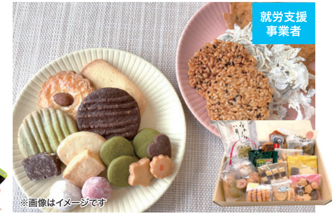
※画像はイメージです ふれ愛プラザ(広島市中区)