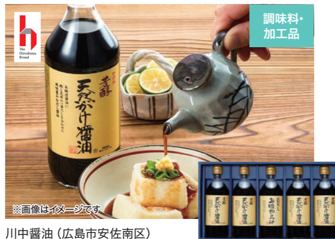
※画像はイメージです 川中醤油(広島市安佐南区)