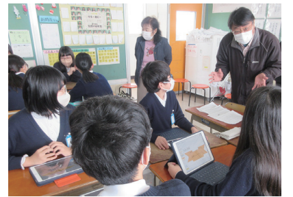
町の魅力を伝える地域の人が、ゲストティーチャーとして授業を行うことも(吉島東小学校)

市は、第1期プランを策定した平成30年以降、教職員の役割の見直しや業務の効率化などを進めてきました。教職員の本来業務である授業や児童生徒の指導に専念できる環境を、地域や保護者の皆さんと一緒に作り、質の高い教育が行えることを目指しています。