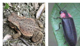
ニホンヒキガエル ハイケボタル