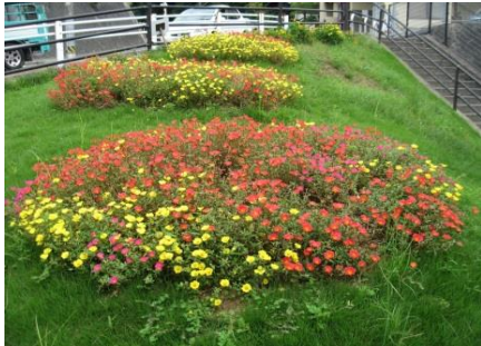
瀬戸内ハイツ入口

安佐南区では、区民のみなさんが主体となって区全体を花でいっぱいに行こうという趣旨に基づき、「安佐南区花いっぱい運動」を行っています。皆さんもぜひ、この運動に参加し、花壇づくりを始めてみませんか。