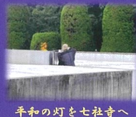
平和の灯を七社寺へ

平和記念公園の平和の灯から採火して灯したろうそくでお迎えします。 灯りにつつまれた七つの社寺をご自由におまわりください。