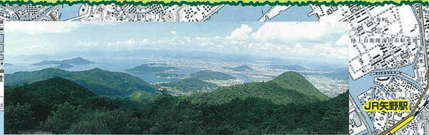
頂上付近からの撮影

山頂付近の絵下山公園には展望台・休憩所が設けられており、そこからの眺望は見事です。絵下山の名前は、師僧のもとで修行する僧の意味である「会下」に由来しているといわれています。地元では、地図上の絵下山を絵下頭、テレビ塔側を絵下山と呼び、発喜山・明神山と合わせて「矢野三山」と親しみを込めて呼んでいます。矢野三山の一つである発喜山には、広島湾東沿岸一帯を領国とした野間氏ゆかりの矢野城址、野間神社のある発喜城址があり、落城の悲話に「火の玉」伝説などを残しています。