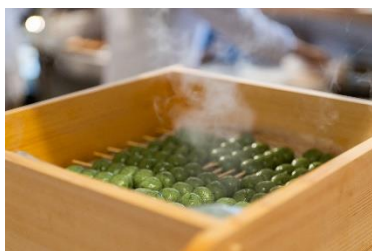
お団子を蒸している所