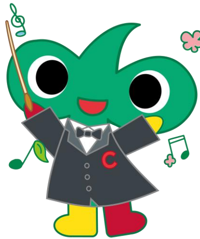
中区のまちづくりのマスコットキャラクター なかちゃん