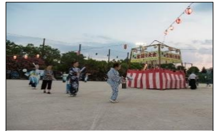
盆踊り大会の様子