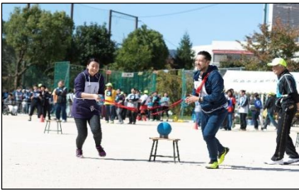
町民体育祭の様子