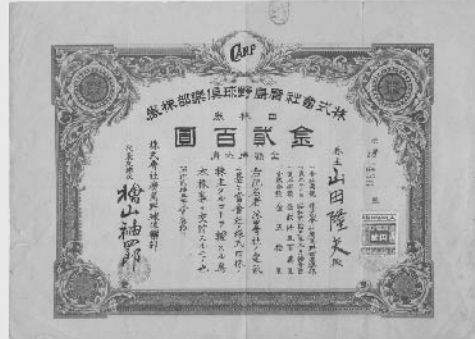
広島野球倶楽部株券