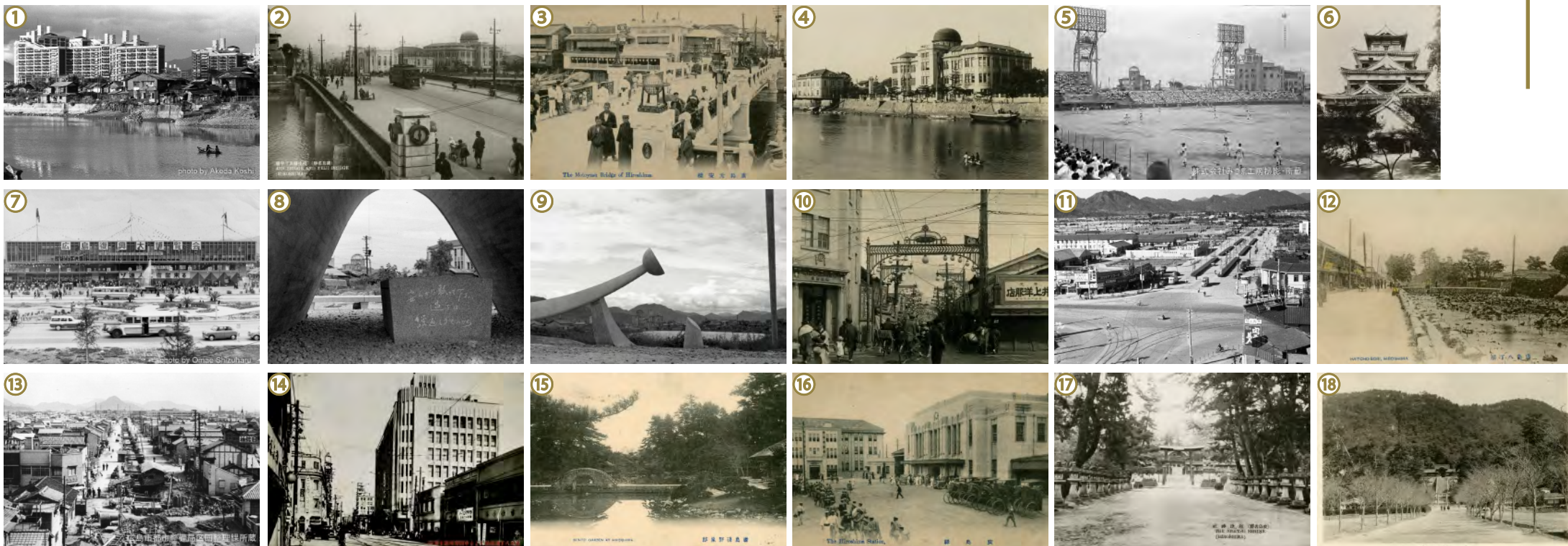
①明田弘司撮影 ⑤みづま工房撮影 ⑦大前静治撮影 ⑩広島市都市整備局区画整理課所蔵 その他は広島市公文書館所蔵

最優秀作品(各撮影ポイントにつき1点程度)の撮影者には、「被爆50周年 図説戦後広島市史 街と暮らしの50年」と「広島市被爆70年史 あの日までそして、あの日から 1945年8月6日」をセットでプレゼント!(1人1セットまで)