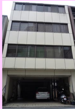
⑦ 神崎地区社会福祉協議会 (神崎ふれあいホール)