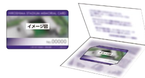
《シリアル番号入り記念カード》