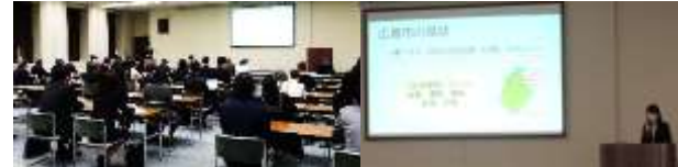
健康経営セミナー