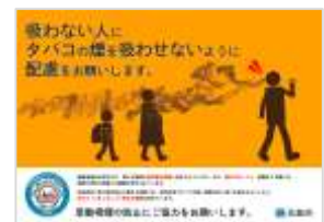
市電車等にてポスター掲出