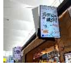
JR広島駅におけるデジタルサイネージ