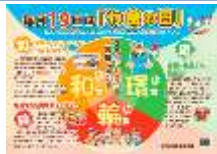
3つの「わ食」啓発用チラシ