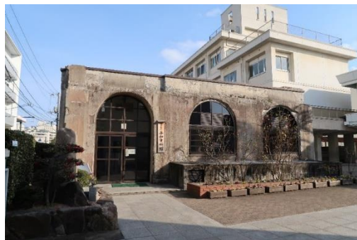
本川小学校平和資料館