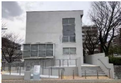
広島通信病院外来棟平和資料館