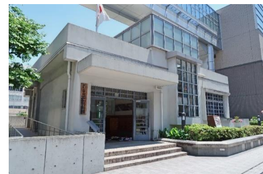
袋町小学校平和資料館