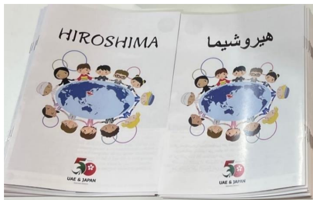
中東向け冊子「Hiroshima」 (左が英語版、右がアラビア語版)

開催日 令和4年11月2日～13日 会場 エキスポセンターシャルジャ (アラブ首長国連邦・シャルジャ市) 来場者 217万人 (国籍数：112)