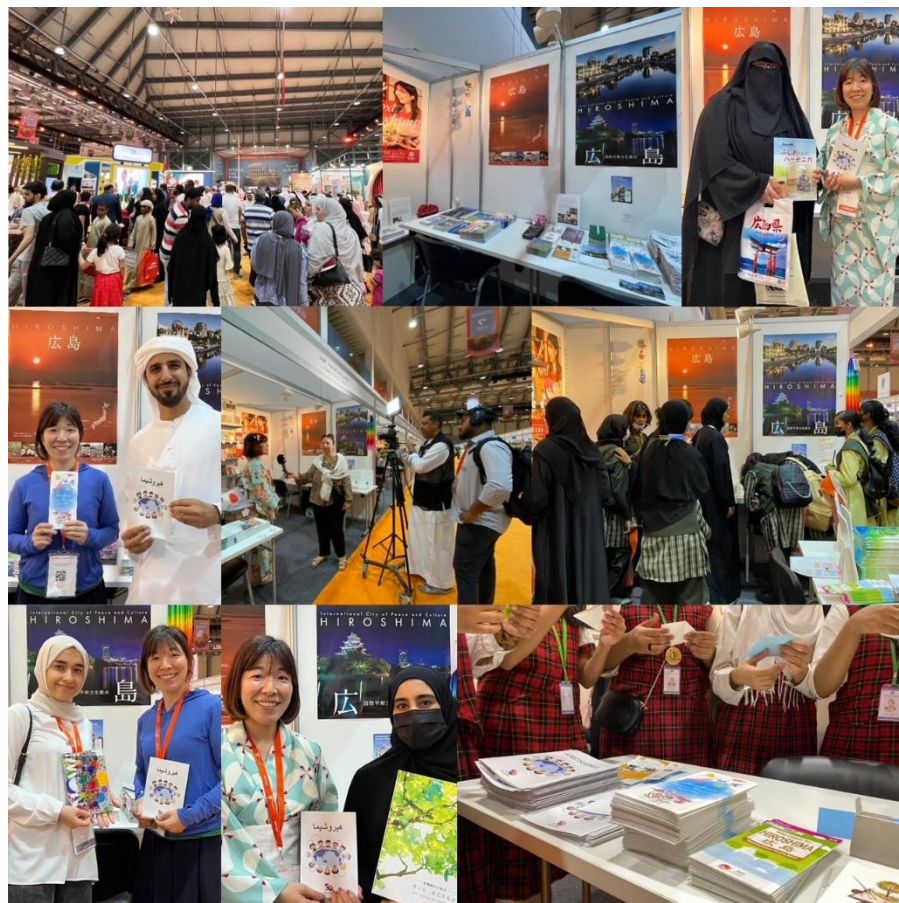
シャルジャ国際ブックフェアの様子 (アラブ首長国連邦・シャルジャ市)

中東向け冊子「Hiroshima」 WEBサイト (英語 P1～P16, アラビア語 P17～P32)