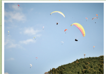
神ノ倉山とパラグライダー