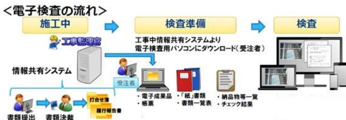
図5 電子検査の流れ

検査においては、情報共有システムで作成した帳票は紙に出力せずに、電子データを利用した検査を行ってください。（必要であれば、紙に出力することも可。）パソコン等検査機器は原則受注者が準備することとし、情報共有システムの検査支援機能により、予め工事帳票をパソコンにダウンロードすることで、インターネットに接続できない環境でも検査ができます。紙帳票については、従来通り紙で検査をしてください。