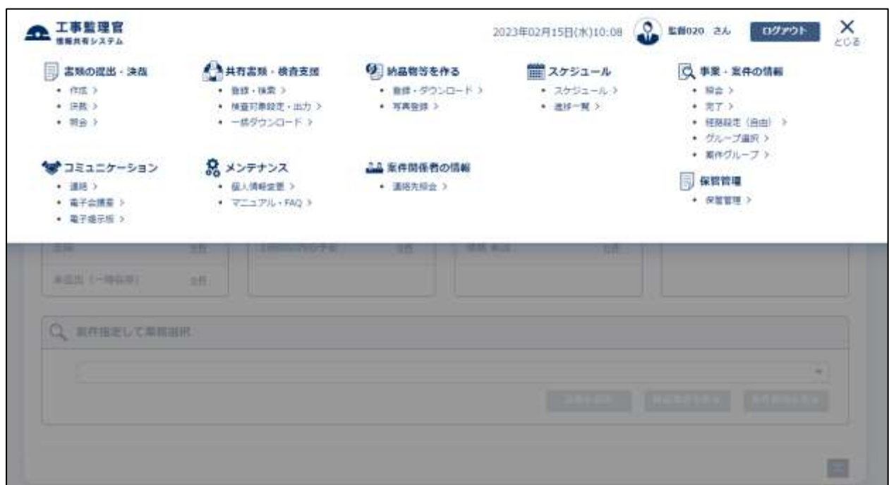
図2 情報共有システムの操作画面