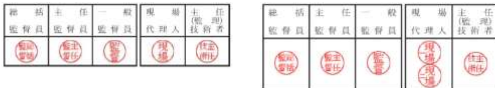
図1 決裁枠イメージ