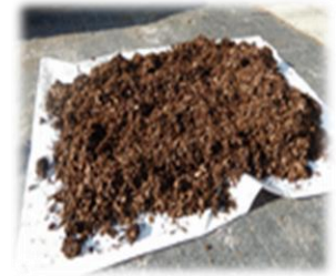
山から集めた腐葉土