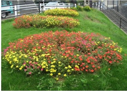
瀬戸内ハイツ入口

安佐南区では、区民のみなさんが主体となって区全体を花でいっぱいにしようという趣旨に基づき、「安佐南区花いっぱい運動」を行っています。皆さんもぜひ、この運動に参加し、花壇づくりを始めてみませんか。