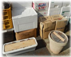
伏せこみ容器の色々

微生物は、畑の土・腐葉土・ヨーグルト・納豆などに入っています。私は山で拾ってきた腐葉土を使います。