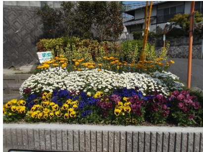
第二祇園が丘団地