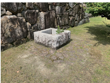
二の丸 井戸跡遺構表示 北東から