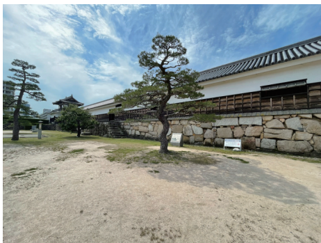
二の丸 多聞櫓と奥に太鼓櫓 北東から