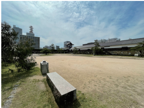
二の丸 全景 (多間櫓、太鼓櫓、東多間櫓を望む) 北西から