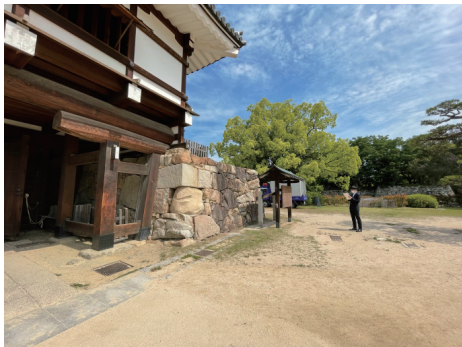
二の丸 表御門石垣と広島城説明板 南から