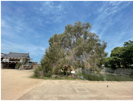
二の丸 被爆樹木ユーカリ 東から