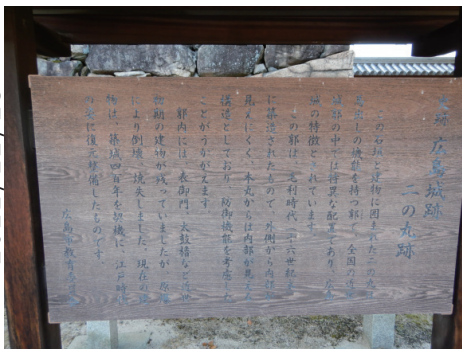
二の丸 二の丸跡説明板（木製） 東から