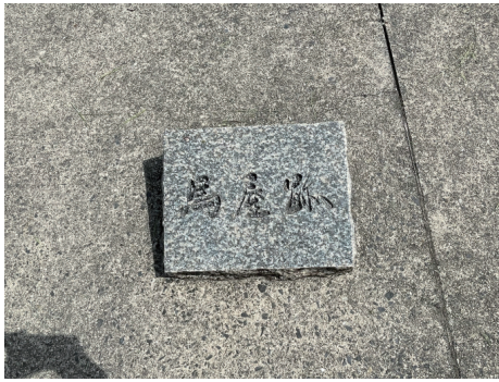
二の丸 馬屋跡名称板 南から