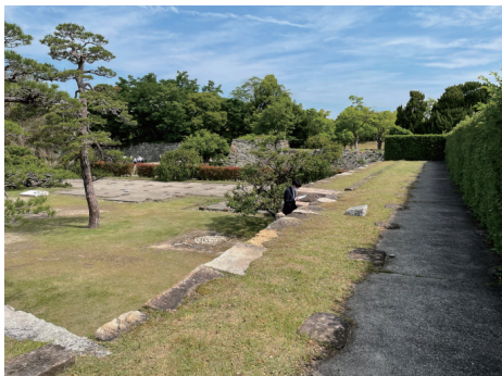
二の丸 東側多聞櫓の上部遺構表示 南から