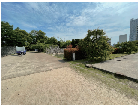
二の丸 本丸標柱付近 南西から（遠景）