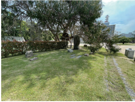
二の丸 北西部 被爆樹木ユーカリと被爆石垣石 西から