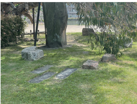
二の丸 北西部 被爆石垣石（被爆樹木ユーカリ付近）