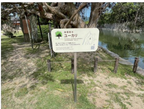
二の丸 被爆樹木ユーカリ説明伴 東から