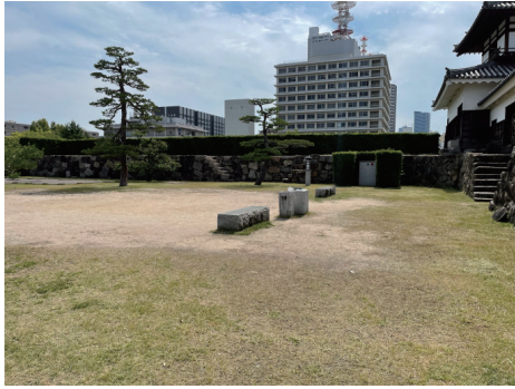
二の丸 太鼓櫓前のベンチ等施設（ベンチ、くず入れ、灰皿、外灯、消火栓ボックス）と東側多聞櫓（植栽は遺構表示） 西から