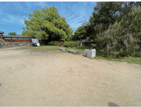
二の丸 北西部のベンチ等施設（被爆樹木ユーカリの西側） 南東から