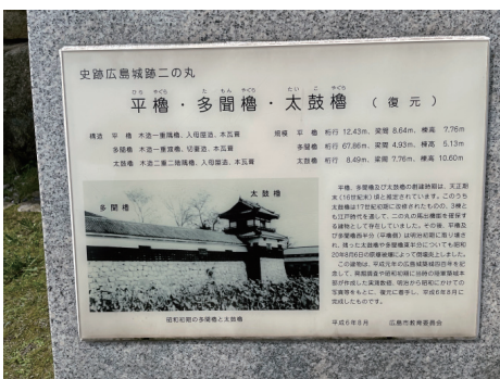
二の丸 平櫓・多聞櫓・太鼓櫓の説明板

平櫓・多聞櫓・太鼓櫓の創建時期は天正期（16世紀末）と推定されている。このうち太鼓櫓は17世紀初期に改修されたものの、3棟ともに江戸期を通して二の丸の馬出機能を確認する建物として存在していた。平櫓、多聞櫓の西半分（平櫓側）は明治初期に取り壊され、残った太鼓櫓、多聞櫓の東半分については原爆により倒壊焼失した。現在の建物は平成6年に完成した。