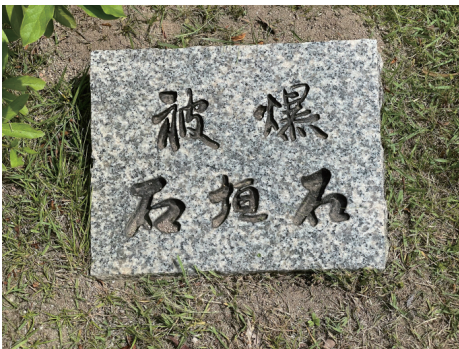
二の丸 北西部 被爆石垣石名称板 南から