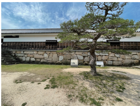
二の丸 平櫓・多聞櫓・太鼓櫓説明板 北から (遠景)