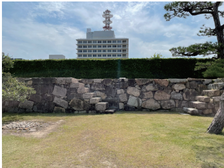
二の丸 東側多聞櫓の石段 西から