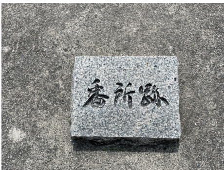
二の丸 番所跡名称板 西から