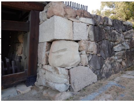
二の丸 表御門北側の被爆石垣の摩耗 南東から