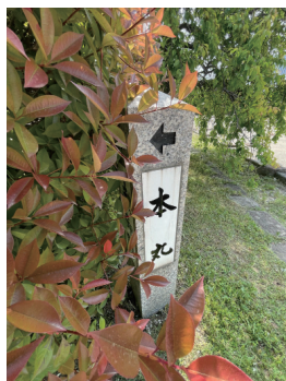
二の丸 本丸標柱 北西から（接写）