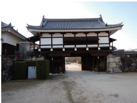
二の丸 表御門 東から