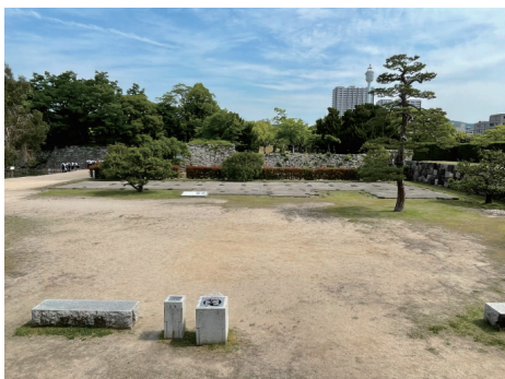
二の丸 太鼓櫓前のベンチ等施設、馬屋跡遺構表示 南から