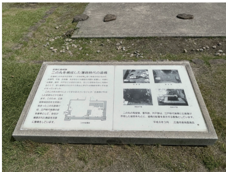
二の丸 馬屋跡南側の遺構説明板 「二の丸を構成した藩政時代の遺構」 南から

概要：二の丸は天正期末（16世紀末）に築造され、表御門、平櫓、多間櫓、太鼓櫓などの建物を周囲に配置し、内部には馬屋、番所、井戸などの施設を整え、本丸を守る馬出の機能を持っていた。二の丸は時代によって形を変えていることが記録から窺えるが、表示は江戸後期に広島藩が作成した絵図を基に整備している。