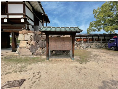
二の丸 広島城説明板 北から