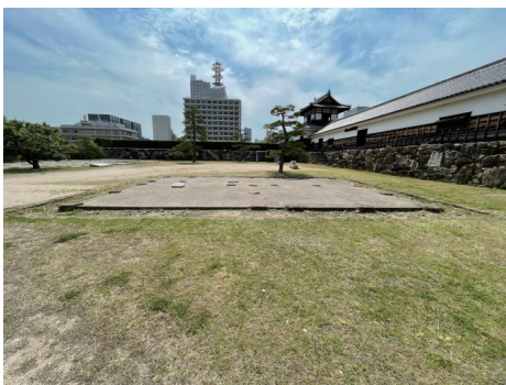
二の丸 番所跡遺構表示 西から