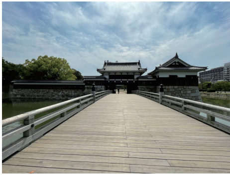
二の丸 御門橋と表御門 西から