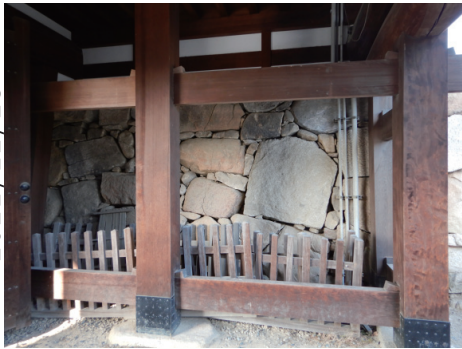
二の丸 表御門北側の被爆石垣 南から