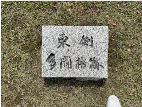
二の丸 東側多聞櫓名称板 西から