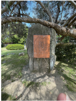
二の丸 広島城跡案内板 (銅板) 「広島城城郭内全域図 (1800年頃)」 東から (近景)