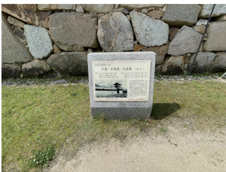
二の丸 平櫓・多聞櫓・太鼓櫓説明板 北から（近景）