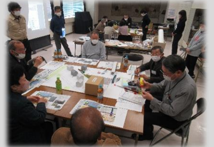
模型修正の様子（B班）