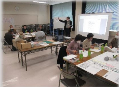
当日の進め方等の事前説明

・専門のコンサルタントよりこれまでの検討結果を基にした公園構想の提案イメージ（案）が示され、最終的なとりまとめに向けた当日の進め方の説明が行われました。