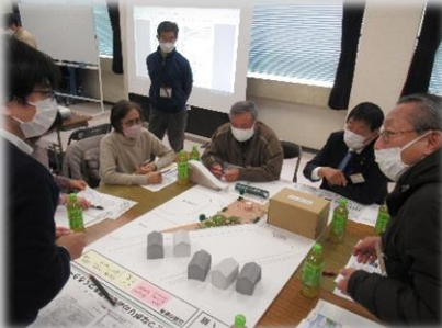
模型修正の様子（A班）

・前回作成した模型を基に、使い方を想定しながら施設や設備、空間のあり方などを再度確認し、模型の追加や修正を行いました。