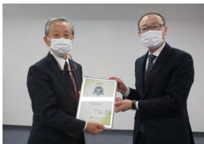
日本政策投資銀行様からDBJ環境格付を受賞