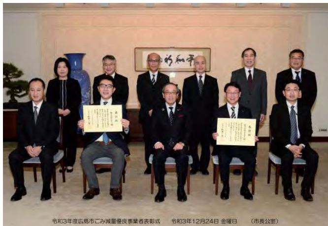
令和3年度広島市ごみ減量優良事業者表彰式 令和3年12月24日 金曜日 (市長公室)