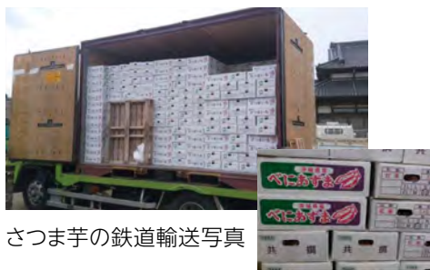
さつま芋の鉄道輸送写真