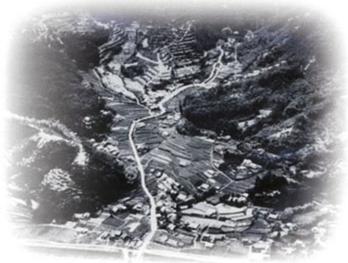
昭和35年(1960年)頃の三滝本町