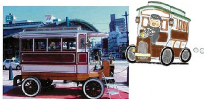
平成17年(2005年)に復元された日本最初の乗り合いバス

山陽鉄道横川駅ができたのは明治30年頃で、可部線にいたっては私鉄として横川—祇園間が開通したのは明治42年(1909年)になってからです。明治38年(1905年)2月5日には日本最初の乗り合いバスが横川—可部間を走っています。