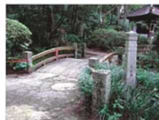
福寿橋(ふくじゅばし)