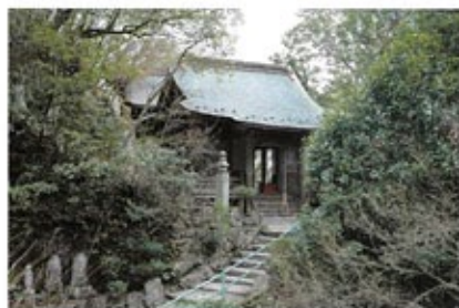
三鬼権現堂(さんきごんげんどう)

現在でも本堂(観音堂)のみならず三鬼権現堂や鎮守堂にもたくさんの人たちがお参りをしています。