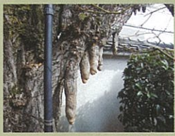
すいじゅう 誓願寺のイチオウの垂乳