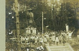
親鸞聖人像の前でのラジオ体操(被爆前)