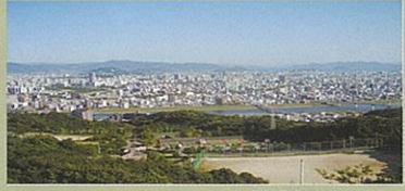
展望台からの眺め