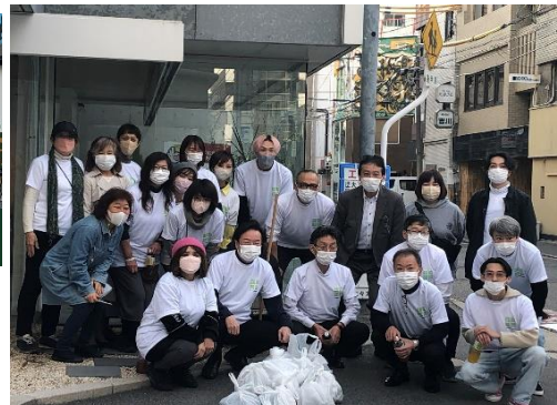
▲通りの清掃活動を通じて、メンバー同士の絆も深まります。通りを歩いてみると予想以上のごみがあり、袋いっぱいになりました。