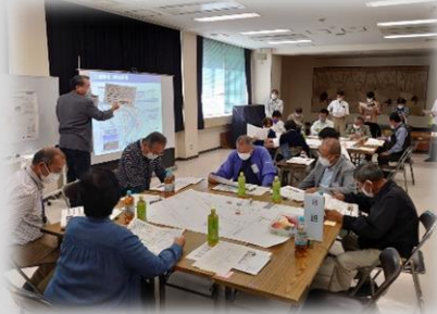
当日の進め方等の事前説明

・専門のコンサルタントより当日のワークショップの流れや進め方、検討に当たっての前提事項や基本方針などの事前説明が行われました。