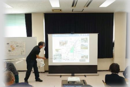
専門のコンサルタントによる説明