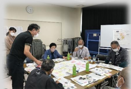
意見等の出し合い（B班）