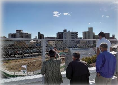
公民館の屋上から確認

・許可を得て己斐公民館の屋上から現地確認をしました。その後、実際の場所へ立ち、広さや周囲との関係などについて確認しました。