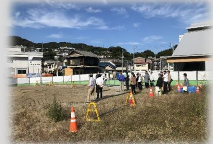
実際の整備場所で確認