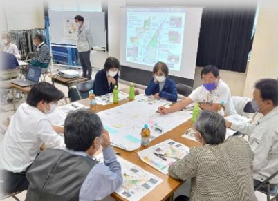
意見等の出し合い（A班）

・現地確認で気づいた点の意見出しを行い、A班とB班に分かれ、アイデアや意見等を出し合いながら公園構想のイメージを膨らませました。