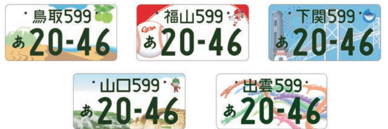
地方版図柄入りナンバープレート(中国管内)

地域の風景や観光資源を図柄にしたナンバープレートのことであり、走る広告塔として地域の魅力を全国に発信している。ナンバープレートの交付申し込みの際にいただく寄付金は、導入地域の交通改善、観光振興などの取り組みに活用される。