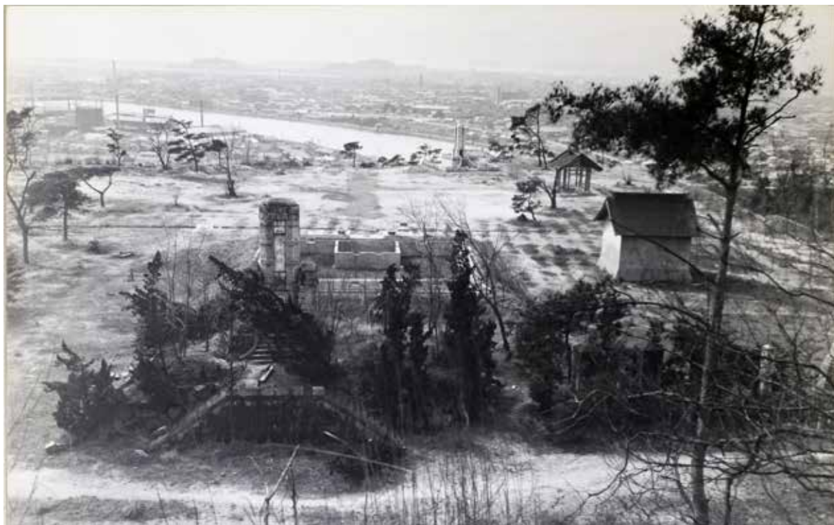
口絵 4 旧陸軍墓地 (1949年2月25日撮影) Special Photographic Report 1949-1950