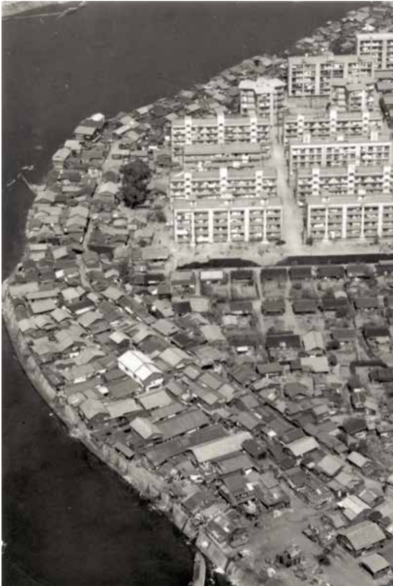
口絵1 「基町／相生通り」の街並み （昭和40年7月撮影） 太田川（本川）河川敷に沿って、今にも川に落ちそうなほどバラックが密集した相生通り