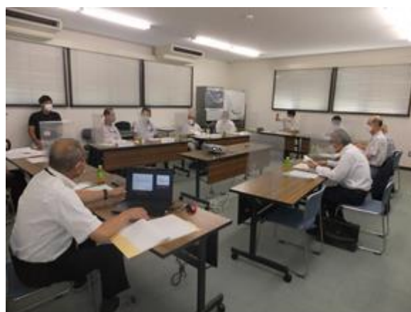
第30回審議会の様子