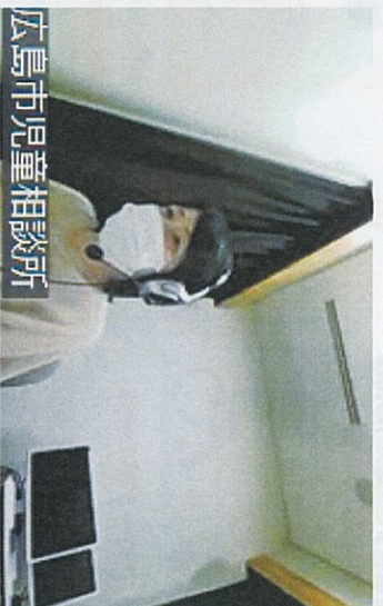
広島市児童相談所

講義内容：広島市児童相談所の業務内容、設備、虐待の定義や動向、早期発見のポイント、通報先や相談先、虐待を受けた児童への支援等