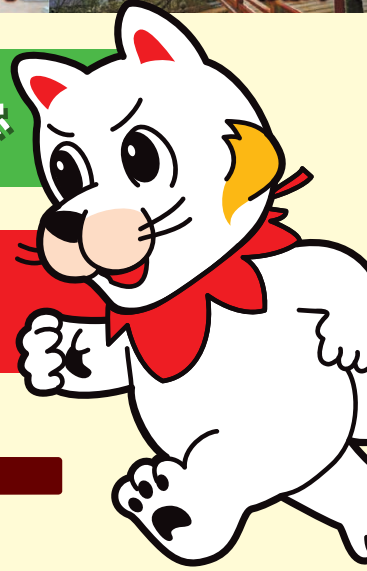
ひろしま都市犬はっしー