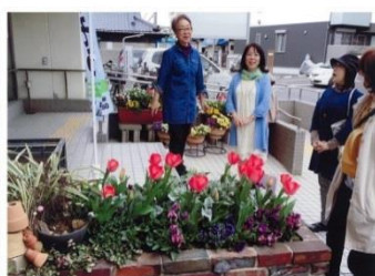
前回の団体の部最優秀賞 大河公民館さんによる 「ようこそ！大河公民館へ！！」

南区内の花と緑のある空間（花壇、庭、鉢植え、プランターなど）を募集しています！入賞者には賞状と記念品を贈呈します。また、表彰式と併せて花と緑の情報交換会を兼ねた寄植え体験を実施する予定です。皆さまのご応募をお待ちしております！