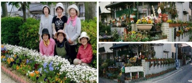
昨年の最優秀賞作品

左・団体の部「花壇の手入れ」仁保第二公園 右・個人の部「小びとのガーデニング」向洋大原町