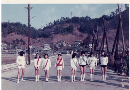
第一回大会は昭和48年に開催された

しかし近年は、少子化、高齢化に伴い、昇降の多い楠那学区の状況では、選手の選出に苦慮するようになり、区間を細分化して参加しやすいようにして、これからも、楠那学区の誇りである駅伝大会を継続していきたいと思えます。