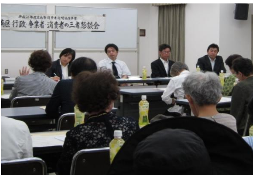
広島市消費者月間協賛事業の行政・事業

者・消費者による南区三者懇談会を6月10日(火)13時30分から南区役所講堂で開催しました。