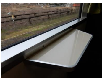
キハ 120 系車内。

学生目線で、店舗だけでなく、自然の風景や神社仏閣などでも立ち寄ってみたい場所が多くあることがわかった。その一部を紹介する。また、立ち寄り調査で、立ち寄った店舗では、調査の目的を説明した。その結果、我々の SNS などでの情報発信などでも、快く許可をいただけた。日常的に利用できる店舗は情報発信を望んでいると考えられ、情報発信の強化の方法の検討が必要と考える。