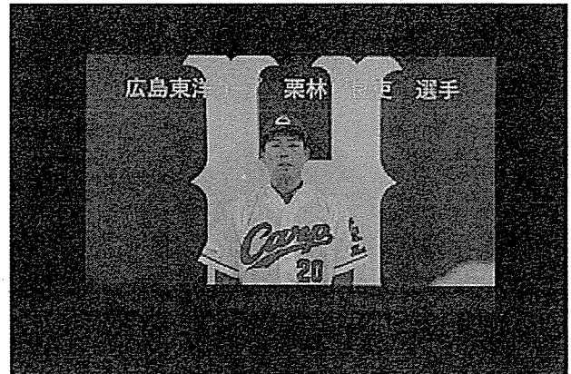
ビデオメッセージ