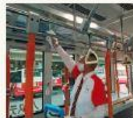
手すりやつり革など、車内は定期的に消毒しています

皆さんが安心して公共交通を利用できるよう、感染リスクを減らすための取り組みを徹底しています。