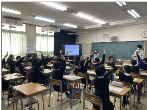
【パワーポイントによる授業】

地球温暖化のしくみや自動車の問題点などについて、国内外の時事問題を取り入れながらパワーポイントで説明するとともに、身近にできる地球温暖化防止の取組によるCO 2 削減量をビニール袋で比較したり、意見を発表してもらったり、電気自動車を見学するなどの体験学習も実施しました。