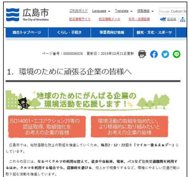
【企業向けのページ】