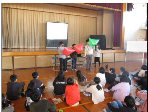
【CO 2 削減量の可視化】