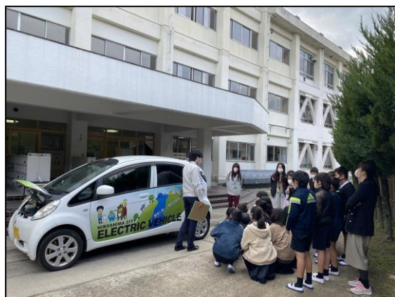
【電気自動車(三菱アイミーブ)の見学】