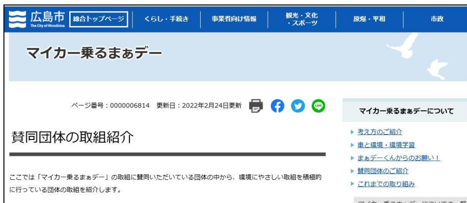
【賛同団体の取組紹介のページ】