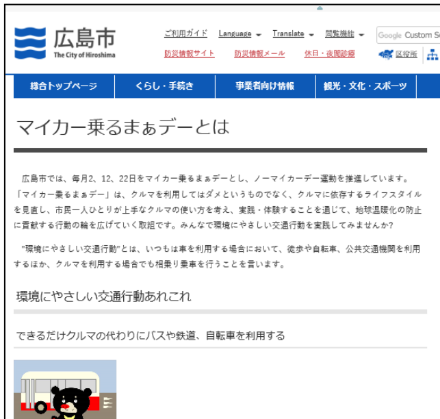
【広島市ホームページ】

交通機関情報などとともに、企業が新たに「マイカー乗るまァデー」の活動に取り組みめるように周知を図りました。