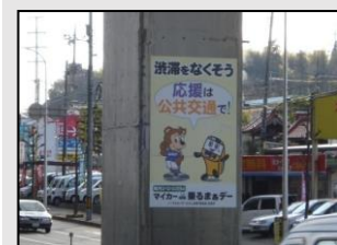
【サンフレッチェとの共同広告】