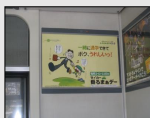
【アストラムライン車内】