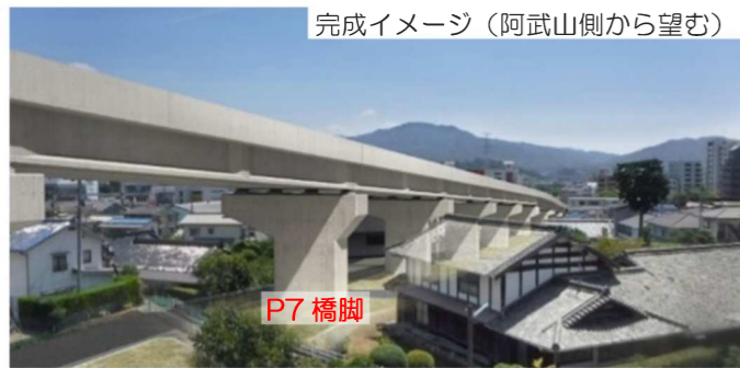
完成イメージ（阿武山側から望む）