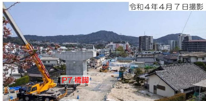
令和 4 年 4 月 7 日撮影