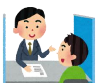
地域包括支援センターに相談

美味しく食べられるように、 短期集中通所口腔ケアサービス を利用してみませんか？歯磨きや入れ歯のお手入れ方法やお口の体操等を教えてもらえますよ。