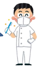
Aさんのかかりつけ 歯科医師

嚙んだり飲み込んだりするお口の機能が低下している恐れがあります。 歯や入れ歯の手入れに加えて、お口の機能を高める体操を試みましょう。まずは、 地域包括支援センターにご相談 ください。