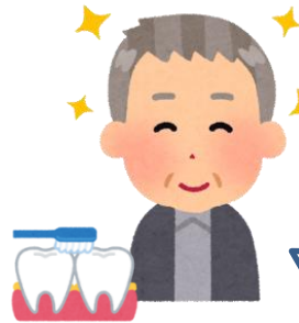
Aさん (サービス利用後)