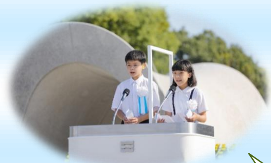
〈平和記念式典〉 こども代表2名による「平和への誓い」