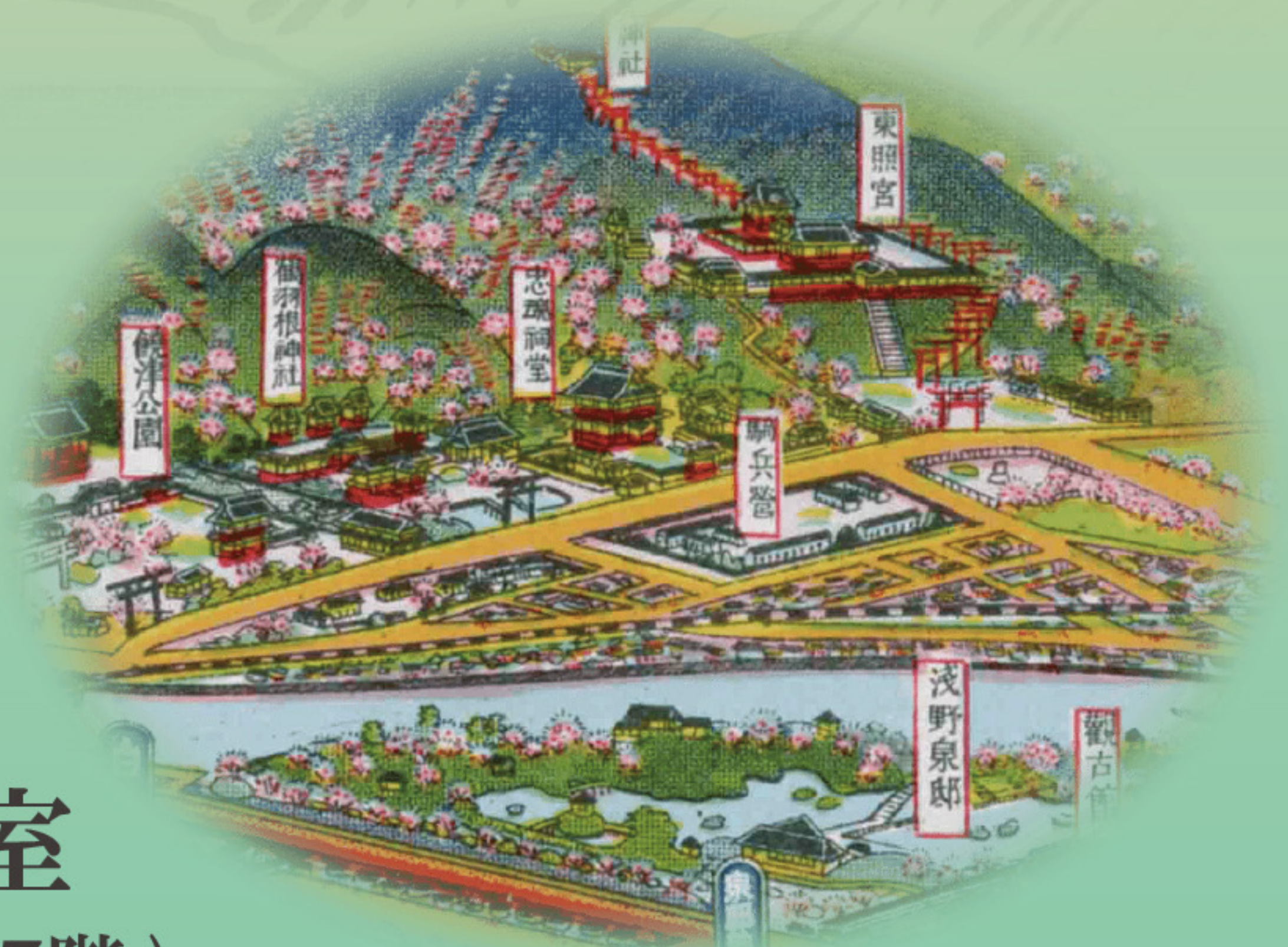
「宮島広島名所交通図絵」より