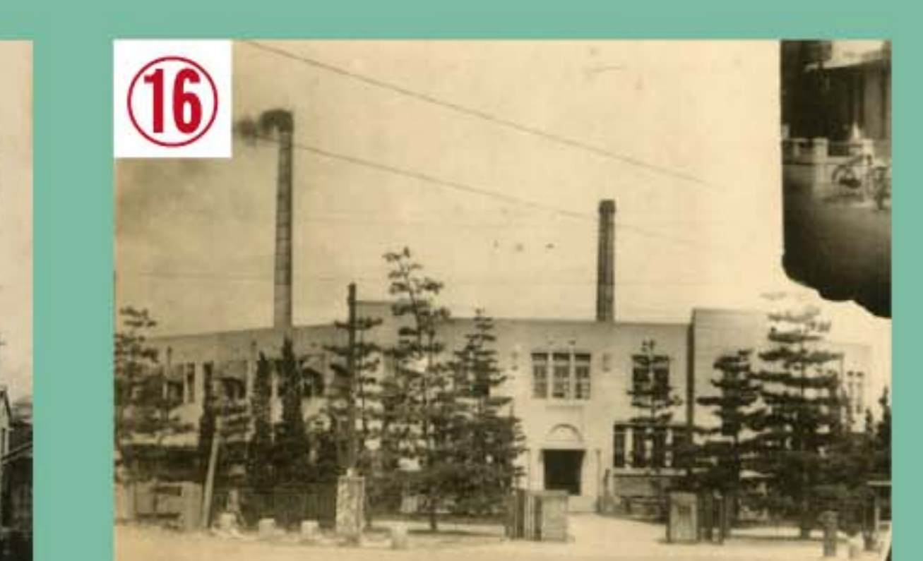
広島市郷土資料館所蔵・提供