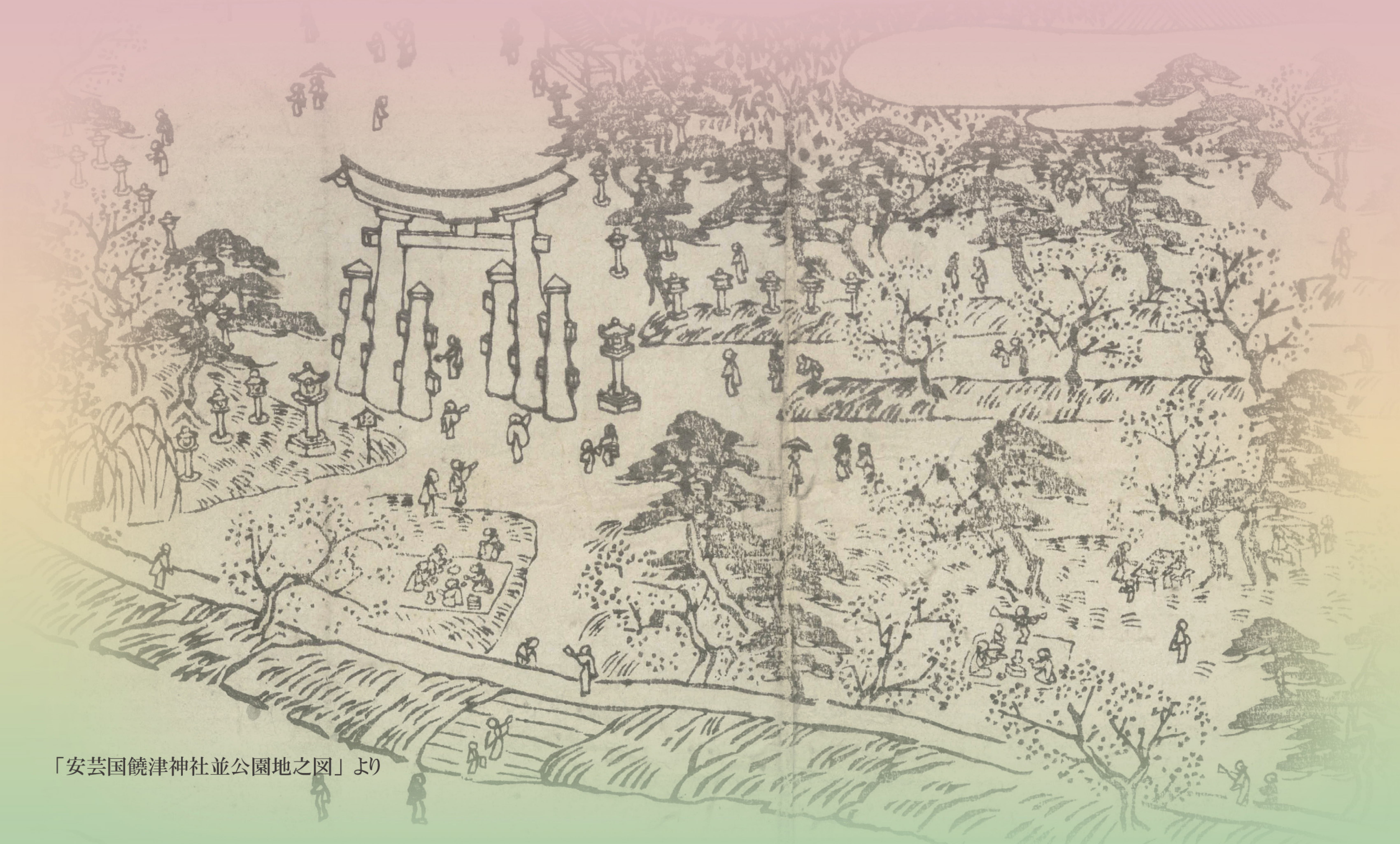
「安芸国饒津神社並公園地之図」より