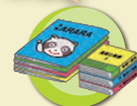
雑誌・クーポン誌