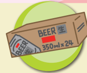
ネットショッピングの外箱 缶飲料のカートン