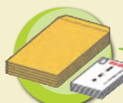
封筒・はがき ダイレクトメール