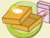
お菓子などの空き箱