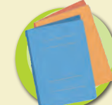
紙製フラットファイル