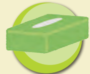
ティッシュボックス