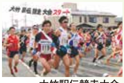
大竹駅伝競走大会