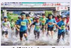
八幡川リバーマラソン