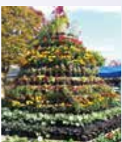
佐伯区民まつり(花の塔)