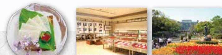
子持ちこんにやく 造幣局広島支局 広島市植物公園

広島市佐伯区は広島市の西端に位置する広島市の8つの区のひとつです。昭和60年に旧佐伯郡五日市町と広島市が合併し、五日市町をそのまま佐伯区としました。また、平成17年に旧湯来町との合併を経て、現在の佐伯区になりました。 区の南部は、清流八幡川沿いに広がった平野部が、極楽寺山などの山々で形成される山地部に取り囲まれており、北部は、水内川が東西に貫流、上流では谷あいの平地に集落が点在し、下流はやや広がりを持つ河川沿いの平地にまとまった集落が形成されています。 湯来地区は、広島県の奥座敷として親しまれてきた「湯来温泉」や広島藩主浅野氏の湯治場でもあった「湯の山温泉」など、恵まれた自然資源を有し、特産品の「湯来の子持ちこんにやく」は多くの方に愛される一品です。また、佐伯区には約1万種類の植物を展示する広島市植物公園や、全国に3箇所しかない造幣局の広島支局があります。年間を通してお楽しみいただける佐伯区へ是非お越しください。