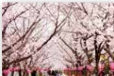
はつかいち桜まつり

この地図は、国土地理院長の承認を得て、同院発行の電子地形図25000を複製したものである。(承認番号 平30情復、第1049号)