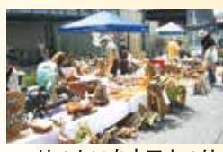
はつかいち木工まつり