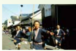
大竹祭(やっこ行列)