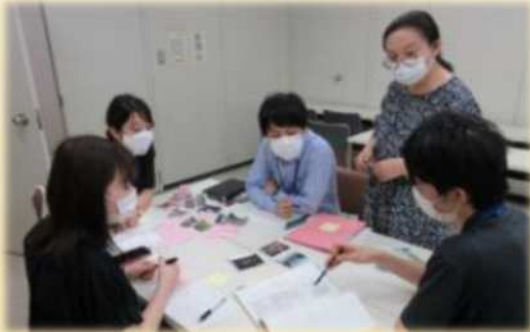
▼プロジェクトチーム会議