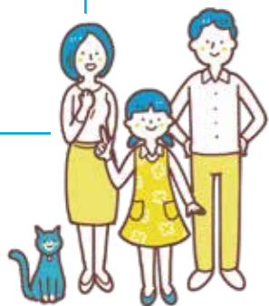
花ちゃん一家 「3R」に取り組み始めた 広島市に住む3人(と1匹)家族