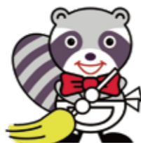
広島市の美化・減量化マスコット「あら」

これらの課題に対応するため、広島市では ごみ処理に関する総合的な取組を進めて、 『ゼロエミッションシティ広島』の 実現を目指しています!