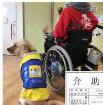
(左) 介助犬とユーザー (右) 介助犬の表示