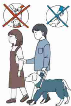
不慣れな場所への誘導

お困りの様子が見られたらユーザー本人に「何かお手伝いしましょうか」「どのようにお手伝いすればよろしいですか」などの声かけや筆談でコミュニケーションをとりましょう。