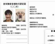
(左上) 身体障害者補助犬認定証