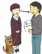
館内放送や電車内のアナウンスの伝達