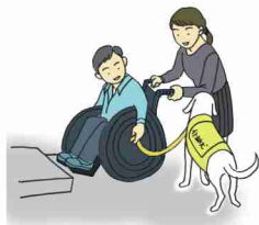
乗り越えられない段差の介助