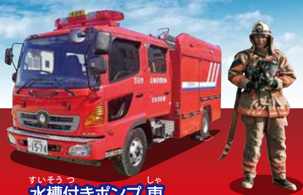
すいそうつしゃ 水槽付きポンプ車