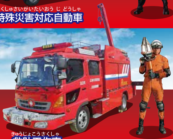
きゆうじよこうさくしゃ 救助工作車