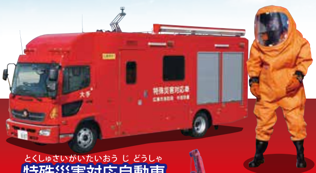
とくしゆさいがいたいおうじどうしゃ 特殊災害対応自動車