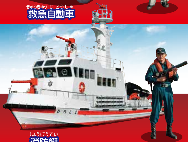
しょうぼうてい 消防艇