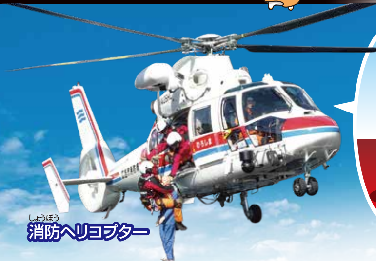
しょうぼう 消防ヘリコプター