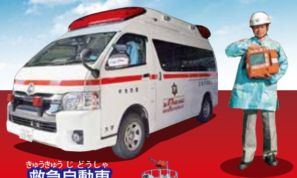
きゆうきゆうじどうしゃ 救急自動車