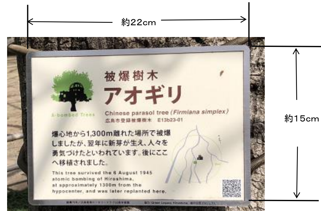
(写真の説明板は歩道に面した高い場所に設置。歩道地面から説明板最上部までの高さは約185cm)