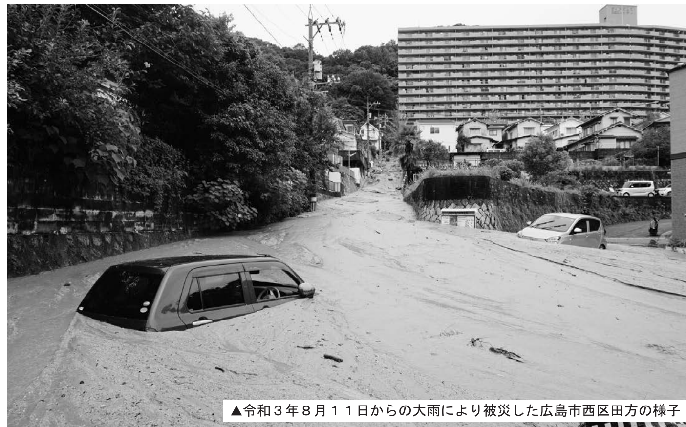
▲令和3年8月11日からの大雨により被災した広島市西区田方の様子

令和3年8月11日からの大雨によりお亡くなりになられた方々のご冥福を心からお祈りいたしますとともに、ご遺族の皆様へ心からお悔やみ申し上げます。また、被災された皆様へ、心からお見舞い申し上げます。