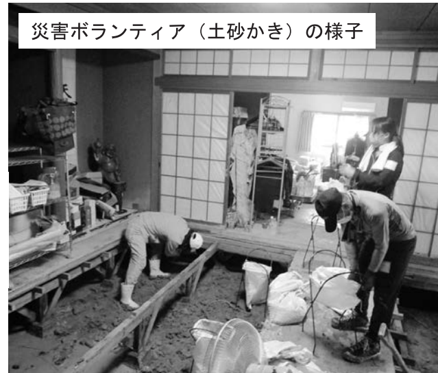
災害ボランティア（土砂かき）の様子

お問い合わせ先：広島市社会福祉協議会 ボランティア情報センター ☎082-264-6408