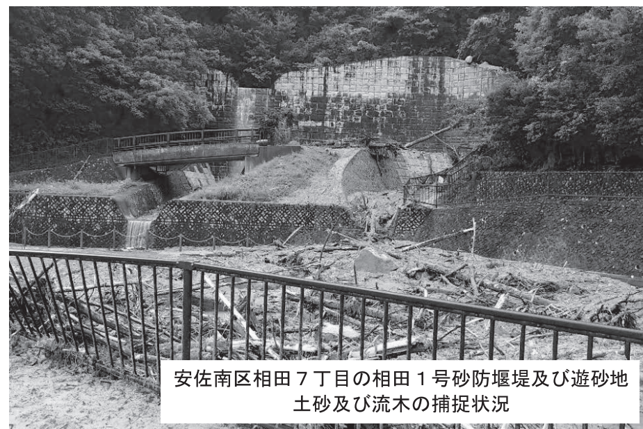
安佐南区相田7丁目の相田1号砂防堰堤及び遊砂地土砂及び流木の捕捉状況

令和3年8月11日からの大雨により、安佐南区相田、緑井、大町地区の国が整備した砂防堰堤の4箇所ですり崩れが発生しました。いずれの箇所も砂防堰堤により土砂を補足し、下流の住宅地への土砂流による被害は発生しませんでした。