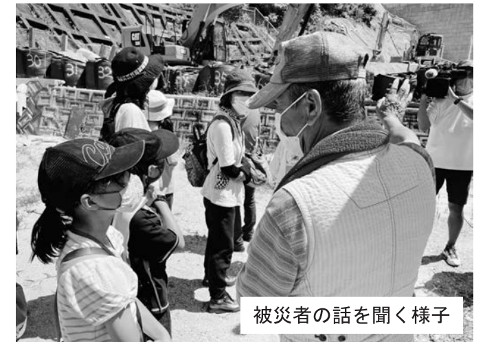
被災者の話を聞く様子

令和3年7月31日（土）、佐東公民館による「親子で学ぶ防災講座」が開催されました。市内の親子14名が参加しマイクロバスに乗って、マップ「水害碑が伝えるひろしまの記憶」を見ながら、安芸区矢野の水害碑を巡りました。安芸区矢野東の梅河団地では、平成30年7月豪雨の被災者の体験談を聞きました。