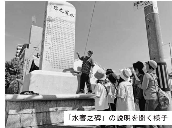
「水害之碑」の説明を聞く様子