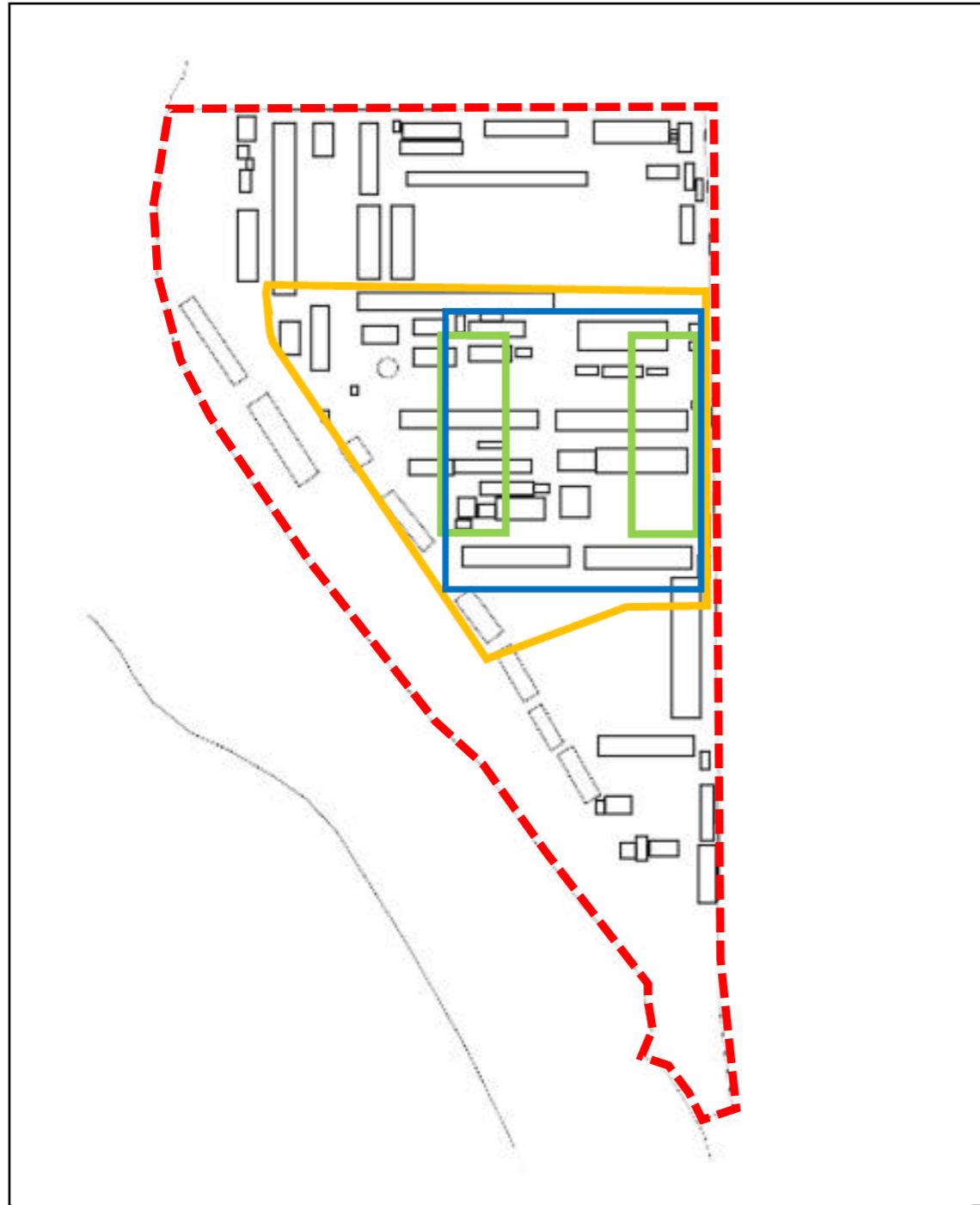
中国軍管区輜重兵補充隊の施設跡地と発掘調査区域等の比較（イメージ図）